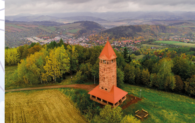
Historická podoba parku / Historyczny wygląd parku